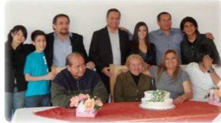
前のホストファミリーの弟、いとこ達とおばあちゃん ↑マリアッチ