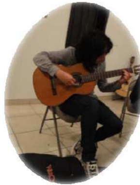
↑ Host Sister!!